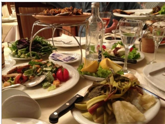
Прогулянка по вечірньому Єревану